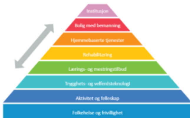
Figur 1 Omsorgstrappa, for en bærekraftig utvikling (Adhocutvalgets rapport 2022)

Å utsette hjelpebehovet og opprettholde selvstendighet er viktig for den enkelte. Samtidig er det å dreie innsatsen nedover i trappa, avgjørende for å sikre tilstrekkelig kapasitet fremover. Hovedbudskapet i den tverrpolitiske anbefalingen var å legge til rette for at flere kan bo i egen bolig, gjennom å: